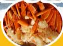
บุฟเฟ่ต์ฮายู