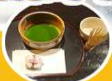
เรียนชงชาแบบญี่ปุ่น