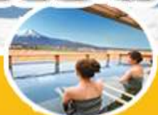
แช่ออนเซ็น