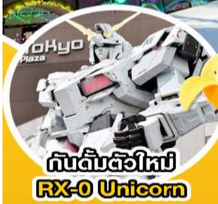
กันดั้มตัวใหม่ RX-0 Unicorn