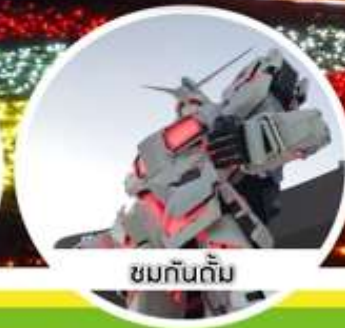
ชมกันดั้ม