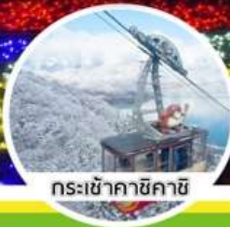
กระเช้าคาชิคาชิ