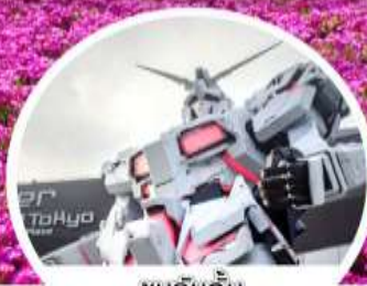
ชมกันดั้ม