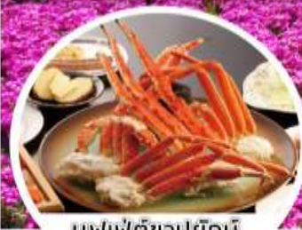
บุฟเฟ่ต์ชาบูยักษ์

5 / 6 / 7 / 8 พ.ย.62 9 / 10 / 11 / 12 / 13 พ.ย.62 14 / 15 / 16 / 17 / 18 พ.ย.62 19 / 20 / 21 / 22 / 23 พ.ย.62