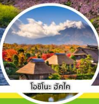
โอชิโนะ ฮักไก