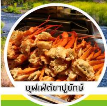
บุฟเฟ่ต์ซาปูยึกษ์

11 / 12 / 13 / 14 / 15 มี.ค.62 16 / 17 / 18 / 19 / 20 มี.ค.62 21 / 22 / 23 / 24 / 25 มี.ค.62 26 / 27 / 28 / 29 / 30 / 31 มี.ค.62 1 / 2 / 3 / 4 เม.ย.62